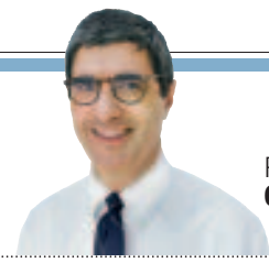
Risponde Gianni Riotta