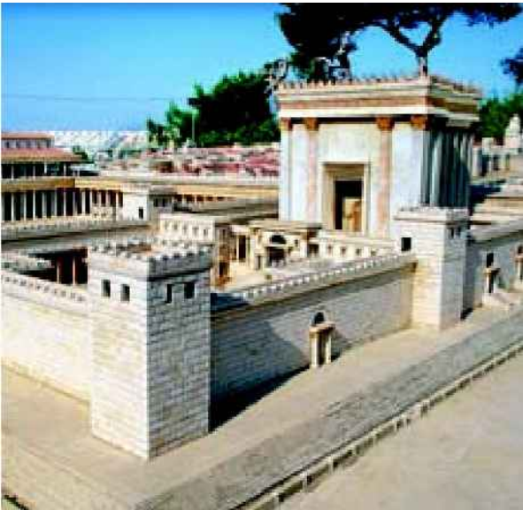
דגם של בית המקדש השני. מרת פולחן לרת הסוגדת לטקסט