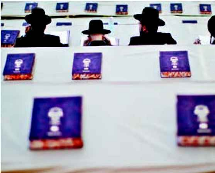
תלמידי ישיבה קוראים בתלמוד. בורות לא הייתה אופציה

ב־500 השנים שלפני חורבן הבית השני נשענה הדת היהודית על שני יסודות: הפולחן שחתבצע בבית המקדש, והקריאה בתורה שכתב. הכהנים היו מקריבים את הקורבנות והמלומדים היו חוגים בתורה. שאר בני העם היו חקלאים אנאלפביתים