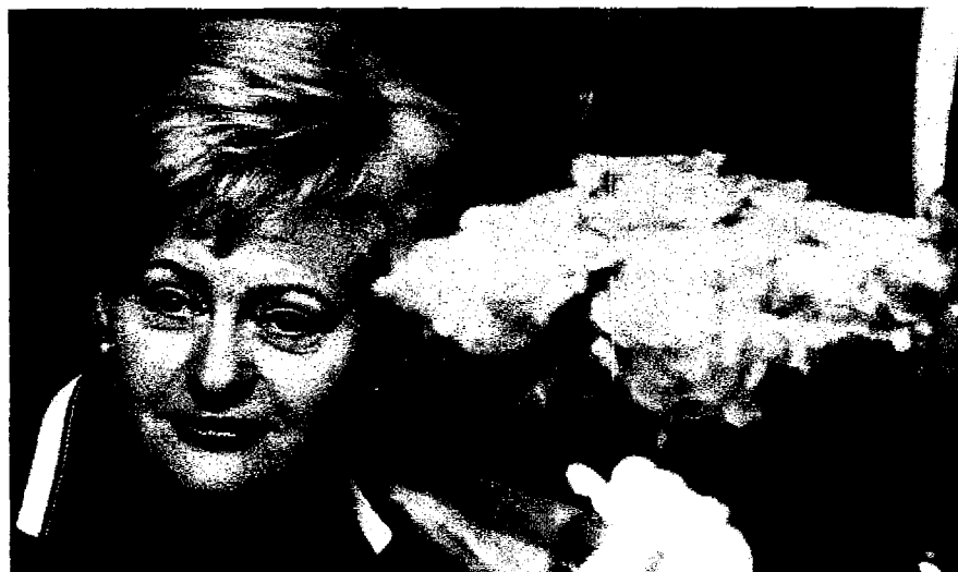
Plebiscito. Dalia Grybauskaitė è stata eletta ieri presidente della Lituania. Ha avuto il 70% dei voti