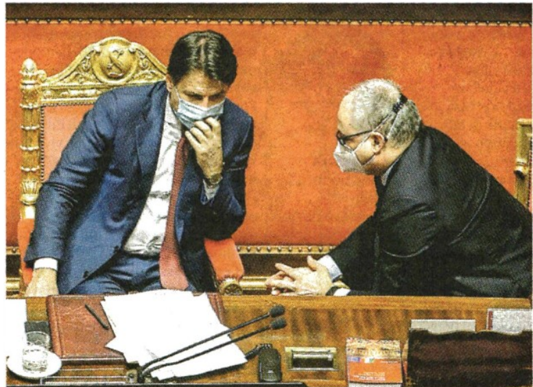
▲ Il premier Conte e il ministro dell'Economia Gualtieri