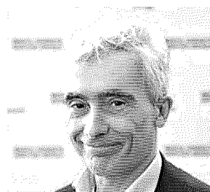
TITO BOERI ECONOMISTA, EX PRESIDENTE INPS

La previdenza è sostenibile grazie all'adeguamento alla speranza di vita